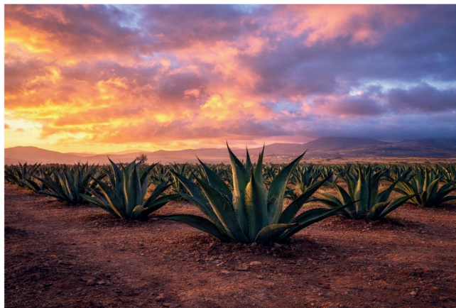
Paisaje magueyero en Singuilucan Hgo.

La diversidad de usos de esta planta fue documentada desde el periodo virreinal por fray Bernardino de Sahagún, quien la describió como el “árbol de las maravillas”. En la actualidad, el maguey continúa siendo parte fundamental del patrimonio gastronómico y cultural de regiones como Hidalgo, Tlaxcala, Puebla, Estado de México y Morelos, donde su cultivo y aprovechamiento permanecen vigentes en la vida de las comunidades.