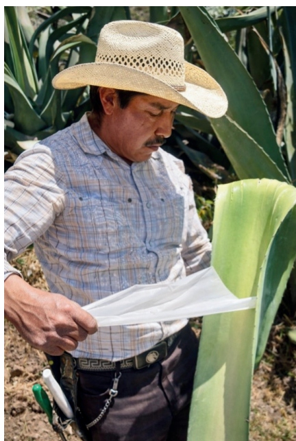
Extracción de "mixiote" (dermis de la penca de maguey)

El Rancho "La Gaspareña" constituye un caso ejemplar de integración entre producción agropecuaria, saberes tradicionales y prácticas turísticas sostenibles. Su análisis permite comprender cómo diversas formas de turismo alternativo convergen en un mismo espacio rural, generando impactos positivos en la sostenibilidad ambiental, la revalorización cultural y la regeneración del paisaje.